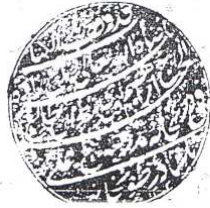
اللوحة الأخيرة من النسخة (ت) التركيبية الأصل